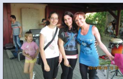
Falunap 2014 (10. old.)