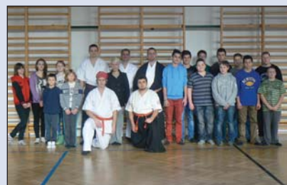
Harcművészek csatasorban (13. old.)