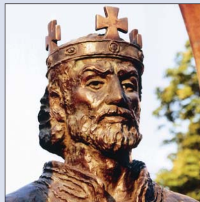
Szent István emlékezete (4. old.)