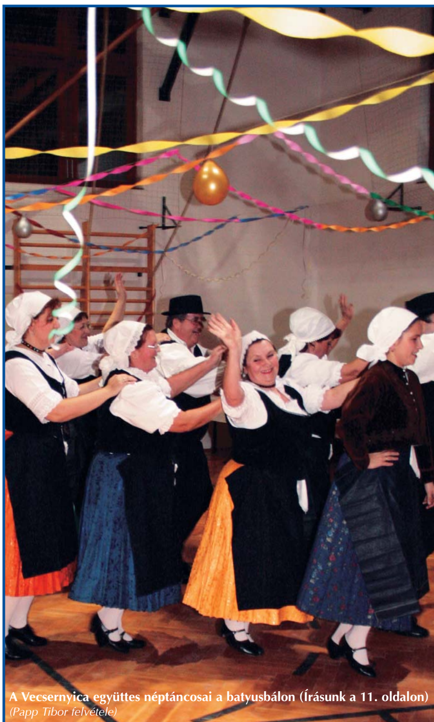
A Vecsernyica együttes néptáncosai a batyusbálon (Írásunk a 11. oldalon)