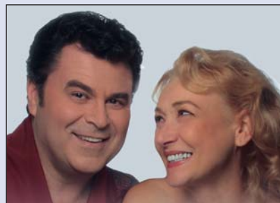
Bemutató a Budaörsi Játékszínben (14. old.)