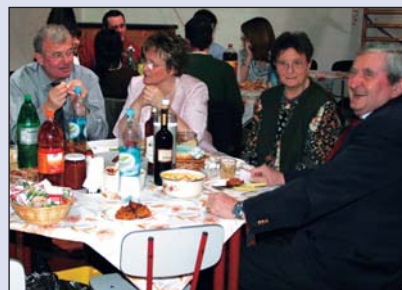
Jó hangulatú batyusbál községünkben (11. old.)