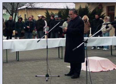
Falukarácsony Pusztazámoron (10. old.)